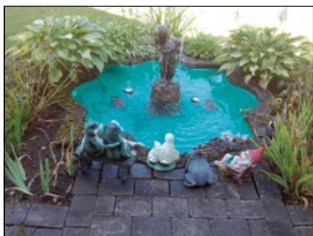
Annika & Tomas Wikström, Lagan

Här är naturen tämjad och varje sten fyller sin funktion. Blandat växtmaterial med många udda träd. Flera dammar och bäckar. Trädgården är fortfarande under uppbyggnad. Höjdpunkter i juni är rododendron, Cypridium och magnolior.