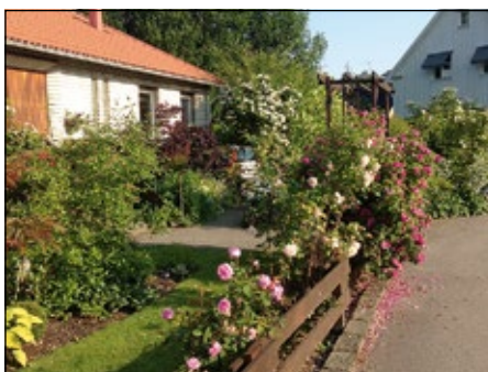
Kerstin Alvesson, Växjö

1300 m 2 + 800 m 2 lånat av kommunen. Många rabatter och växtslag. Magnolia, Sorbus, Acer och rododendron. Hepatica, Anemone, Cypridium, ormbunkar och andra lundväxter. Azaleor, iris och pioner ger färgfyrverkeri i juni.