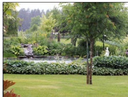
Ingvar Andersson, Hok

2000 m 2 strandtomt vid Vidösterns sjö, uppbyggd med sten och egentillverkad konst i olika material. Växtmaterialiet är blandat med samlarväxter i olika typer av rabatter, liksom fina köksland. Trädgården är under uppbyggnad.